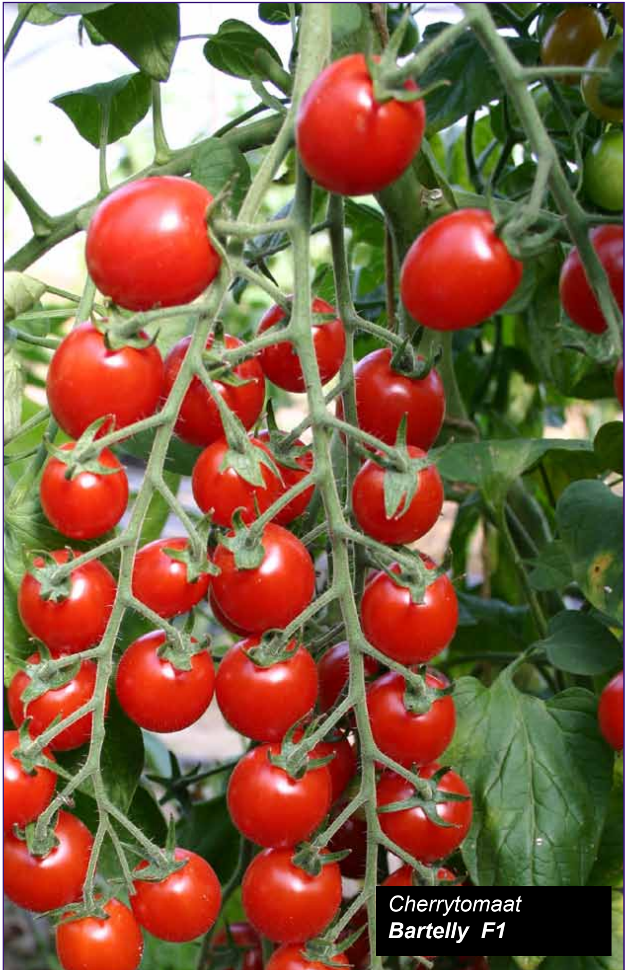
Cherrytomaat Bartelly F1