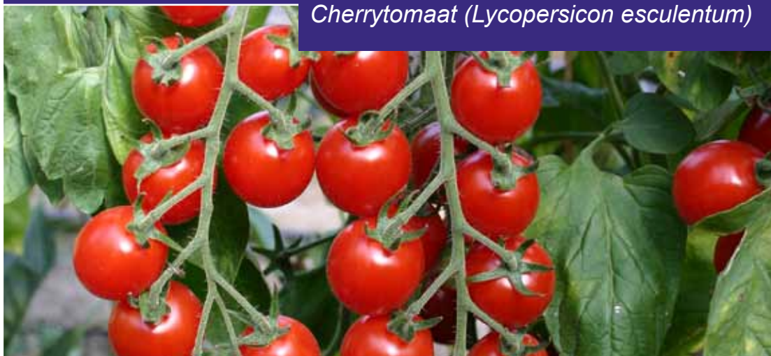
Cherrytomaat (Lycopersicon esculentum)